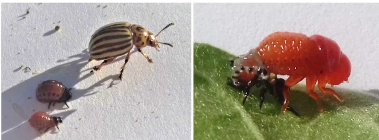
Slika 2: Levo odrasel koloradski hrošč in ličinki na različnih stopnjah razvoja, desno ličinka med levitvijo

Po 1. svetovni vojni je v Evropo iz Amerike prišel nov krompirjev škodljivec – koloradski hrošč. Najprej so ga leta 1921 zaznali v Franciji ( https://plus.cobiss.net/cobiss/si/sl/bib/44184576 ). Pred uporabo insekticidov ali namesto nje so hrošče in njihove ličinke pobirali ročno. Po 2. svetovni vojni se je koloradski hrošč razširil tudi v Vzhodno Evropo. Na vzhodni strani železne zaves so napade tega škodljivca izkoristili za politično propagando ( https://www.berliner-zeitung.de/en/29-amikaefer-li.117029 ), saj so ga predstavljali kot biološko orožje zahodnega bloka (več slikovnega gradiva je na voljo tukaj ( https://omniblog.quora.com/Potato-beetle-propaganda )). Odziv krompirja ob napadu koloradskega hrošča so začeli raziskovati v 60. letih prejšnjega stoletja. Odkrili so ( http://www.esalq.usp.br/lepse/imgs/conteudo_thumb/Clarence-Bud-Ryan-A-Biographical-Memoir.pdf ), da se ob poškodbi nadzemnih delov v celotni rastlini poveča vsebnost proteinaznih inhibitorjev. Ti inhibitorji zavrejo delovanje prebavnih encimov proteinaze, ki so prisotne v črevesju koloradskega hrošča. Povečanje količine proteinaznih inhibitorjev vodi v slabši prirast tega škodljivca. Nadaljevanje teh raziskav, ki so se začele na krompirju, je vodilo v odkritje ključnih elementov obrambe rastlin ob poškodbah in napadih škodljivcev.