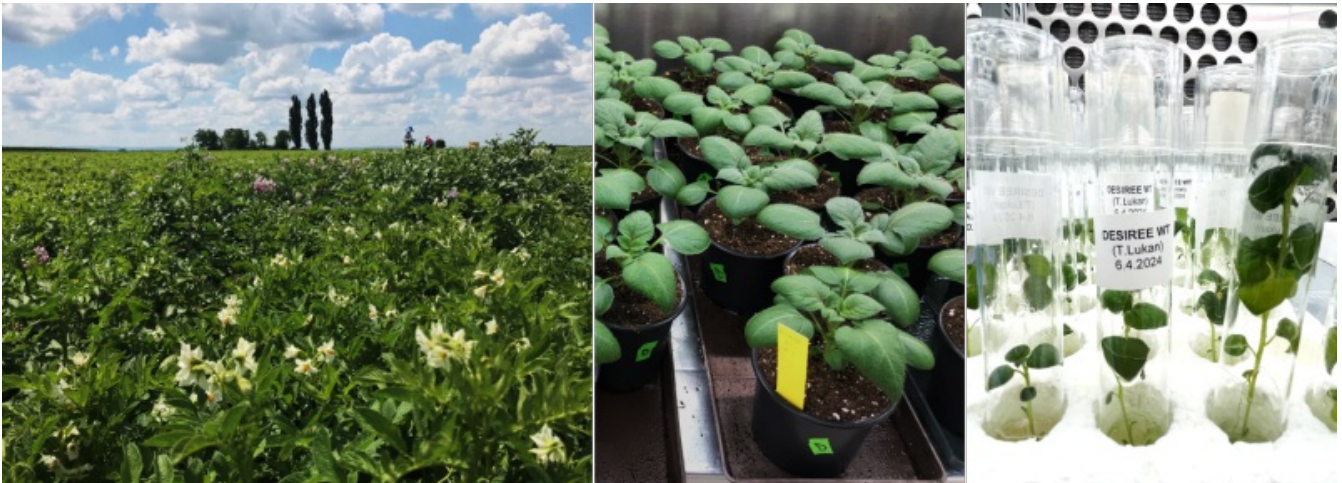
Slika 3: Krompir na polju in v laboratoriju v zemlji ter tkivnih kulturah

Zakaj torej pri nas raziskujemo ravno krompir? Zdaj lahko povzameva, da se v naši skupini pri krompirju srečujejo raziskave temeljne in že bolj aplikativne znanosti. Temeljne raziskave se danes dotikajo predvsem razvoja sistemske biologije ( https://en.wikipedia.org/wiki/Systems_biology ) pri rastlinah. Pri tem vključujemo omične metode, pri katerih spremljamo npr. ravni izražanja vseh genov proučevanega organizma, in matematično modeliranje odziva celotnega omrežja genov, saj poleg jakosti njihovega izražanja spoznavamo tudi povezave med njimi na različnih ravneh. Tako proučujemo kompleksne lastnosti, v katere je vključeno veliko število genov in pri katerih obravnava posamičnih genov ne razloži dogajanja na ravni celotnega organizma. Med takšne kompleksne lastnosti sodijo že omenjeni odzivi rastlin na škodljivce in neugodne vremenske razmere pa tudi na simbiotske organizme. Uporaba orodij sistemske biologije pri raziskavah na krompirju olajša prenos oziroma aplikacijo tega temeljnega znanja, saj z njimi odkrivamo npr. nove genetske markerje za odpornost krompirja na stresne dejavnike: okužbo s PVY, napad koloradskega hrošča, sušo, vročino in preveliko namočenost tal. Te markerje bodo v prihajajočih letih v programe žlahtnjenja vključevala številna svetovna podjetja, pri nas pa tudi Kmetijski inštitut Slovenije.