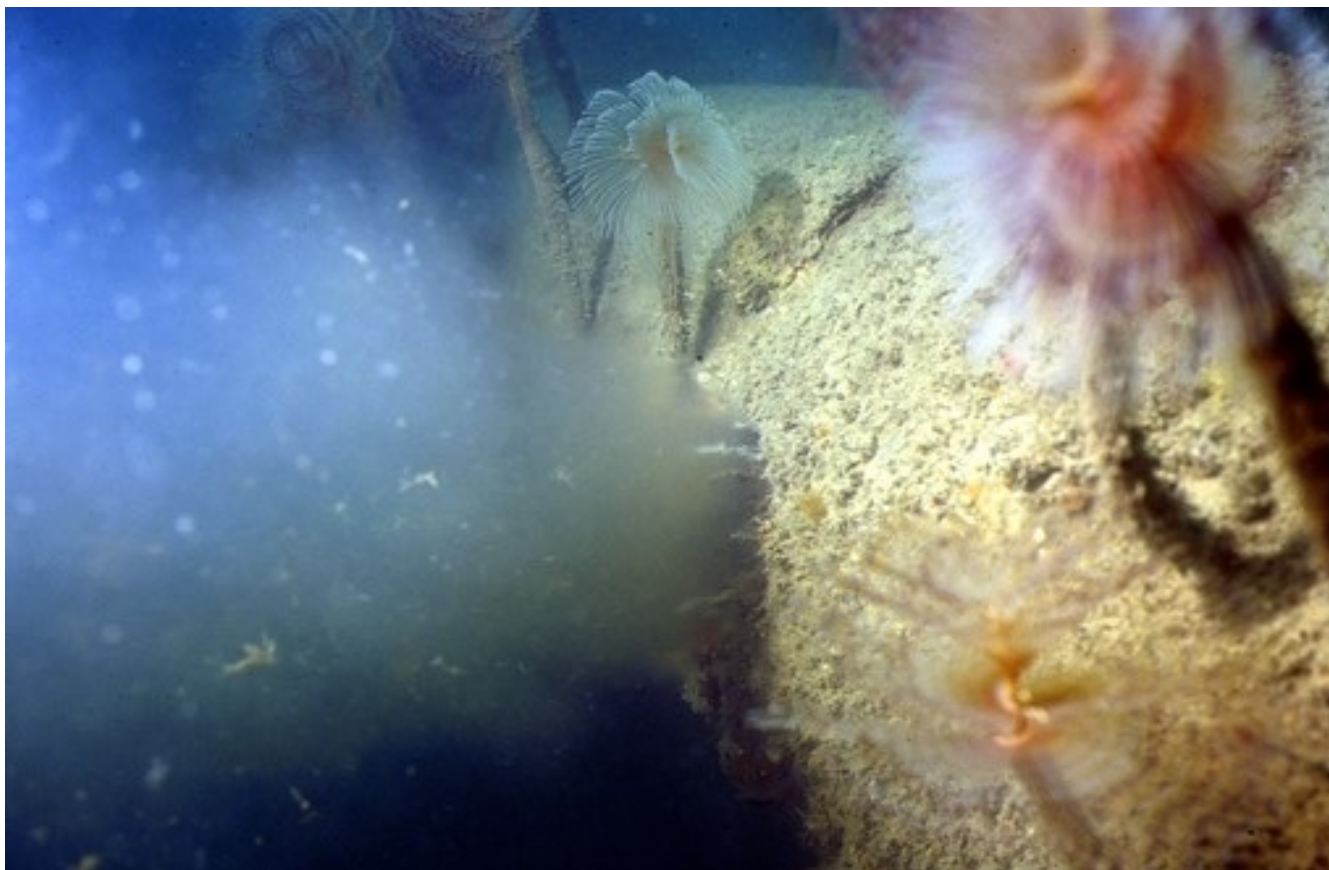
Slika prikazuje izpust odpadne vode iz podvodnega cevovoda čistilne naprave Piran. Centralna čistilna naprava Piran prečiščeno odpadno vodo odvaja preko dveh podvodnih izpustov dolžine 3600 m in 3450 m, ki imata na koncu difuzor.