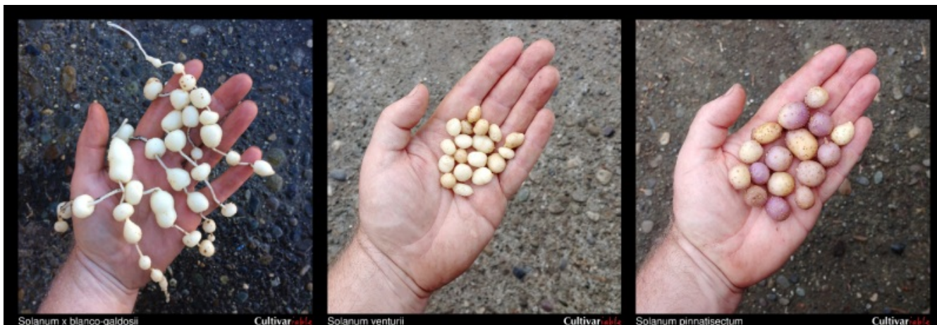
Slika 1: Gomolji divjih vrst krompirja. Nekaj vrst hranimo v tkivnih kulturah tudi na NIB.

Krompir je torej Evropi zagotovil prehransko varnost, ki je žita niso mogla, čeprav imajo ta v primerjavi s krompirjevimi gomolji večjo obstojnost, o čemer priča rek ( http://www.dlib.si/?URN=URN:NBN:SI:doc-ZWRKFYMR ): »Amerikanski denar je kakor krompir, samo za eno leto.« Kljub temu je imel krompir v prehrani pomembno vlogo, saj so ga uporabljali kot osnovno živilo, medtem ko ga danes poznamo predvsem kot prilogo ( https://plus.cobiss.net/cobiss/si/sl/bib/44184576 ) k drugim jedem. Zaradi njegovega pomena pri zagotavljanju prehranske varnosti je bilo tveganje ob napadu boleznih ali škodljivcev toliko večje. Med boleznimi je zagotovo najbolj znana krompirjeva plesen, ki je v letih 1845–1849 na Irskem povzročila veliko lakoto ( https://core.ac.uk/download/pdf/67544287.pdf ). Na to bolezen so bile zelo občutljive ravno vrste, ki so izhajale iz Čila, medtem ko so se andske vrste izkazale za odpornejše. Zato so začeli čilske vrste konec 19. stoletja križati z divjimi vrstami ( https://doi.org/10.1038/s41559-019-0921-3 ), odpornimi na plesen. V tisti čas segajo tudi prvi poljski poskusi na Slovenskem ( http://aas.bf.uni-lj.si/december2012/12Dolni%C4%8Dar.pdf ), v katerih so preverjali primernost različnih sort za tukajšnje rastne pogoje.